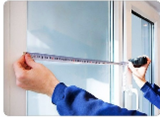
Дод. послуги з монтажу