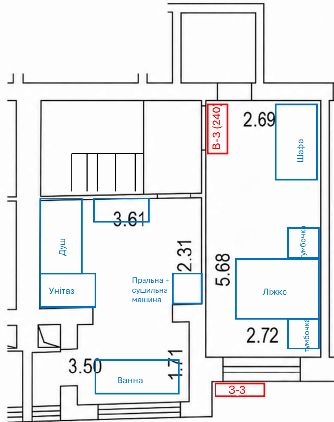
Схема кондиціонерів(10 поверх)

В – внутрішня частина кондиціонера З – зовнішній блок