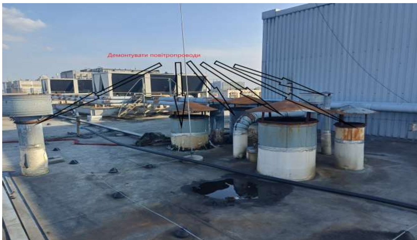
7. Повітропроводи в вент шахті