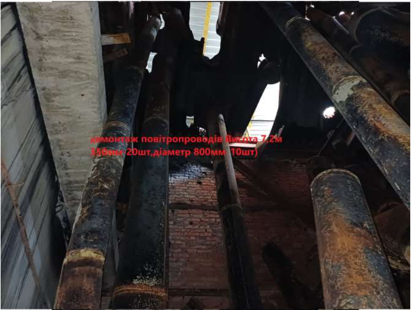
8. Несучий каркас конструкції покрівлі вид з вент шахти