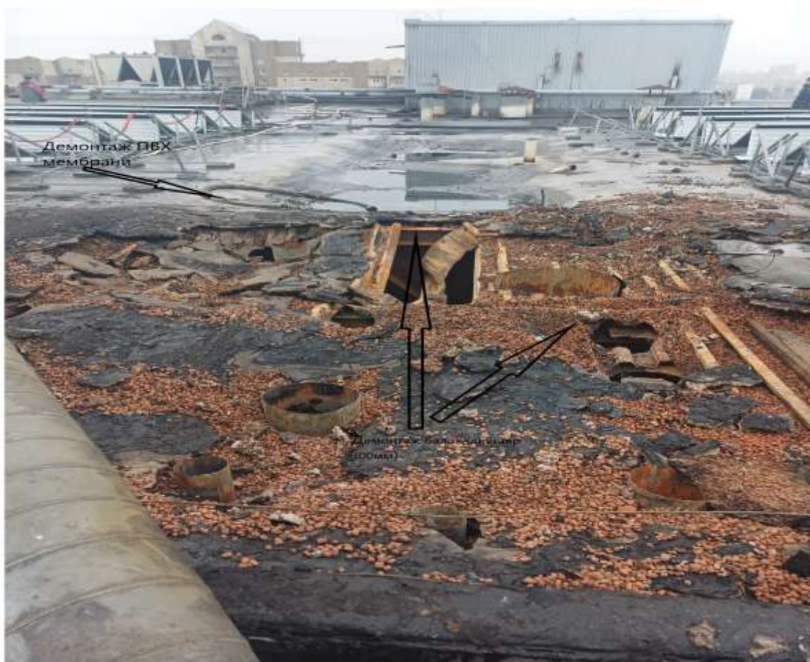
6. Демонтаж повітропроводів