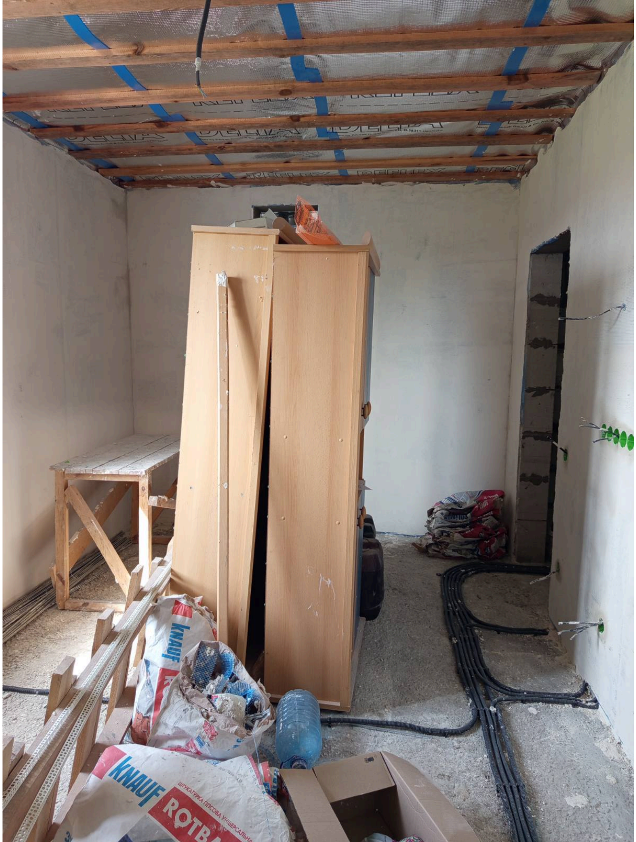
Тут показаний невеликий зріз кута по короткій стороні.